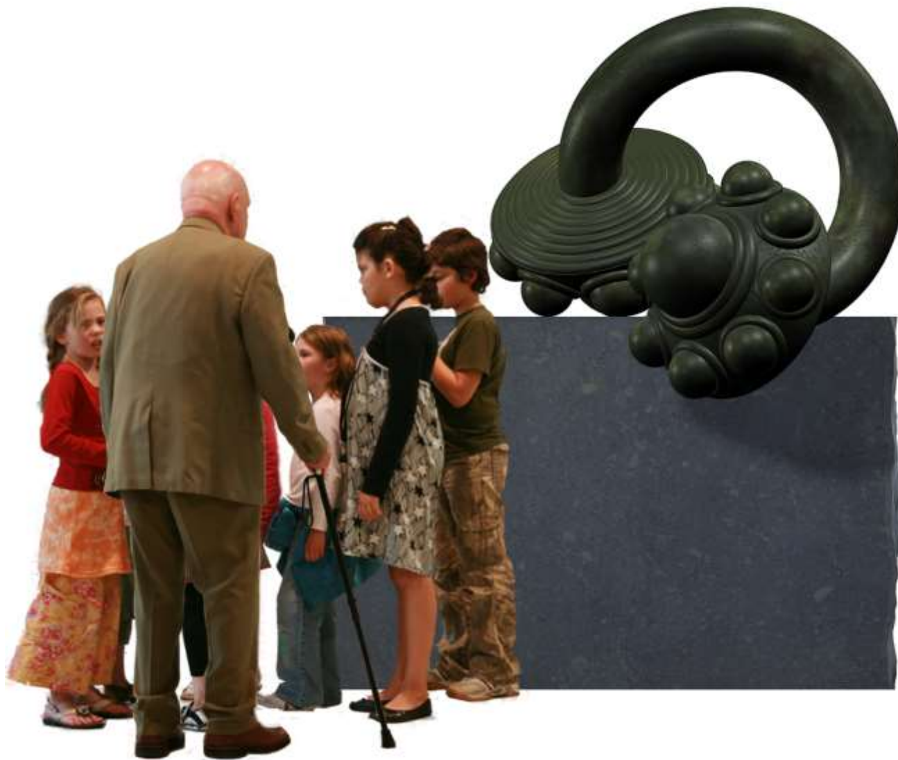
Een schakel in het doorgeven van waardevol Zeeuws cultureel en natuurlijk erfgoed van oudere naar jongere generaties