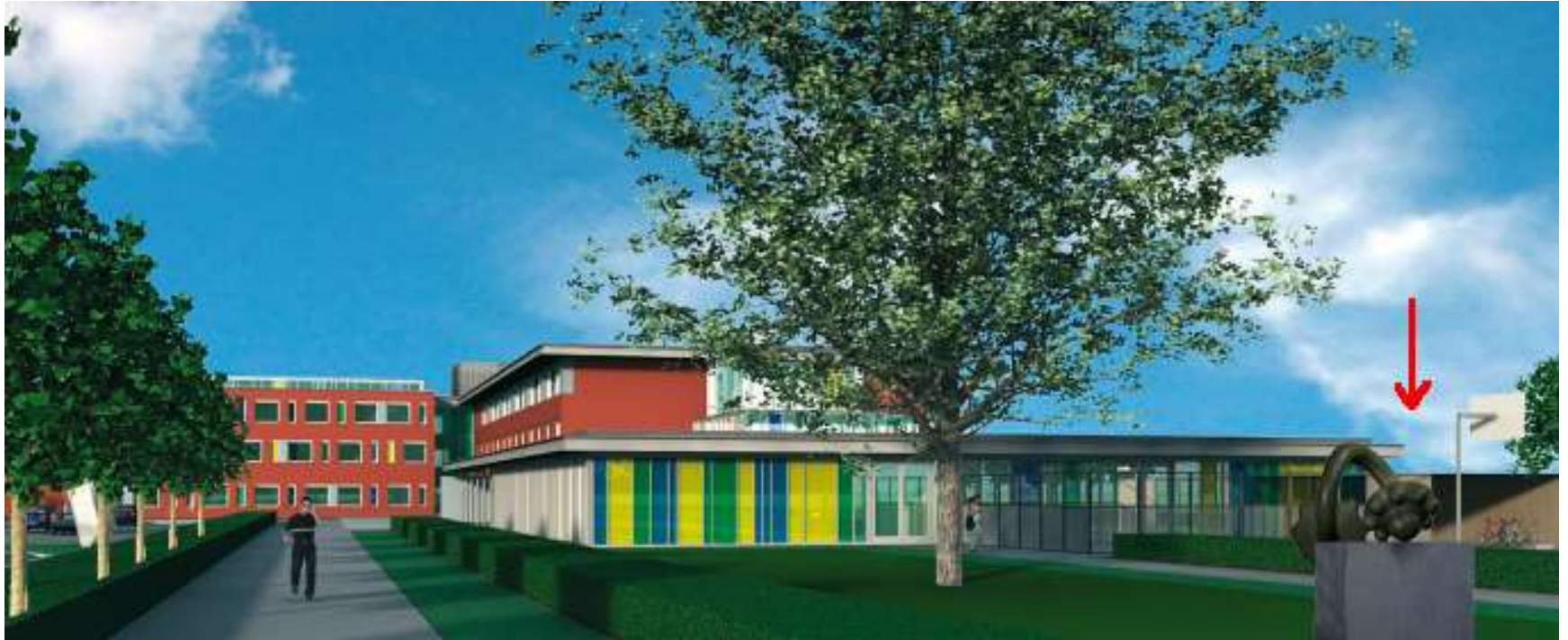
Gebouwen zorgcomplex Molenhof en de locatie van het beeld