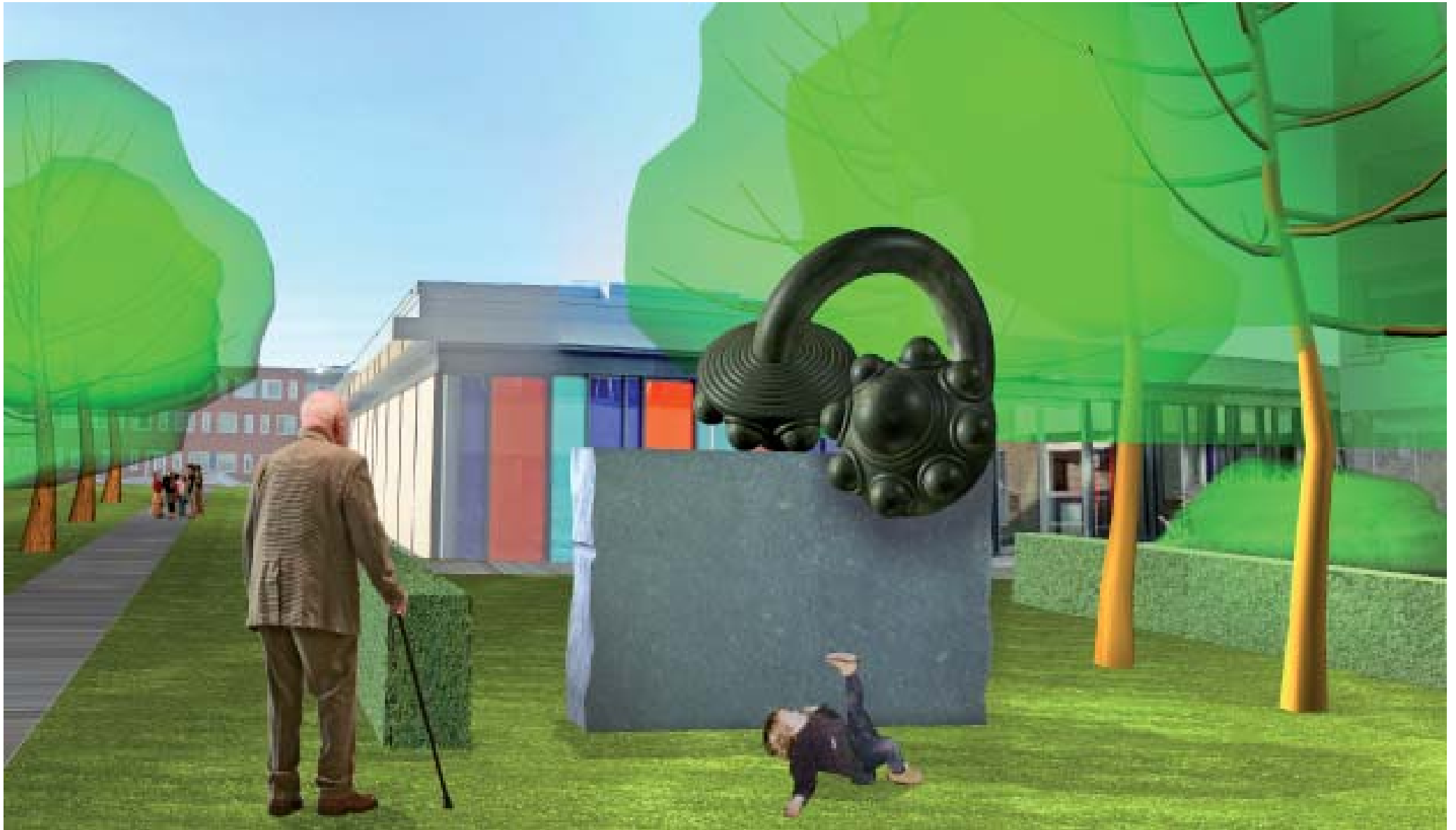
Beeld gesitueerd tussen het speelveld voor de jeugd en de jeu de boulesbaan voor de ouderen.