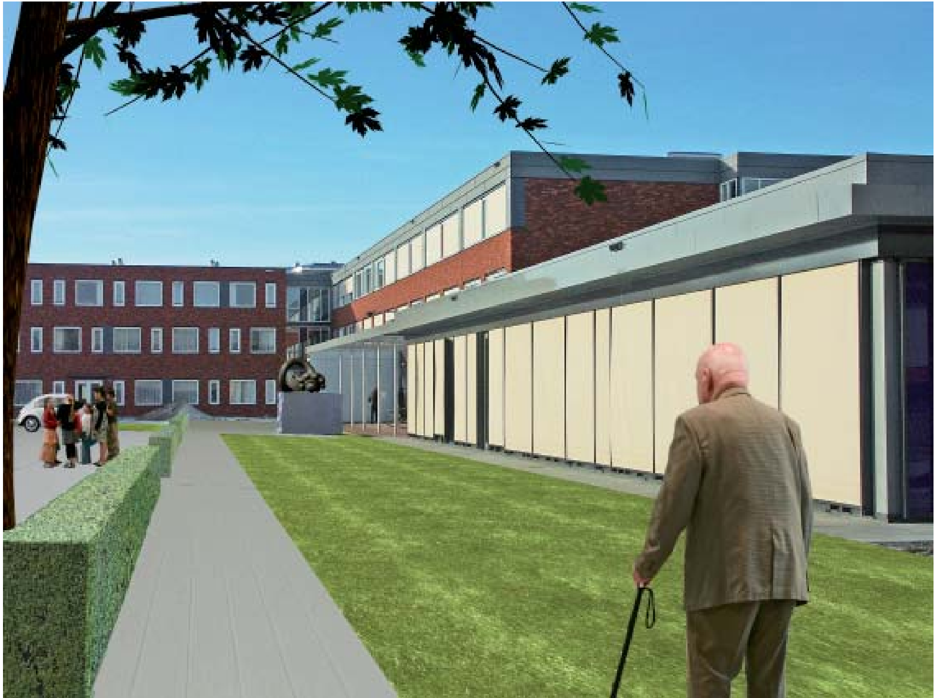
Beeld gesitueerd bij ingang zuidzijde Molenhof.