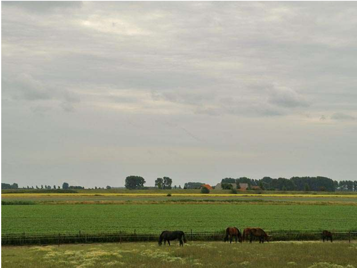
het vlakke land